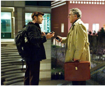
2011 CONTAGION (Contagion) de Steven Soderbergh avec Elliott Gould