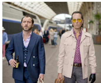
2013 DOM HEMINGWAY (Dom Hemingway) de Richard Shepard avec Richard E. Grant