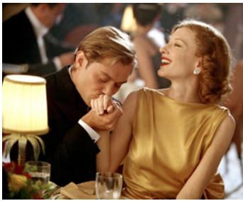
2004 AVIATOR (The Aviator) de Martin Scorsese avec Cate Blanchett