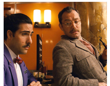
2014 THE GRAND BUDAPEST HOTEL de Wes Anderson avec Jason Schwartzman