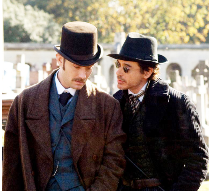
2009 SHERLOCK HOLMES (Sherlock Holmes) de Guy Ritchie avec Robert Downey Jr