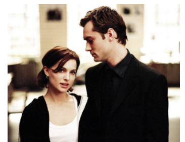
2004 ENTRE ADULTES CONSENTANTS (Closer) de Mike Nichols avec Natalie Portman