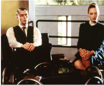
1997 BIENVENUE À GATTACA (Gattaca) d'Andrew Niccol avec Uma Thurman