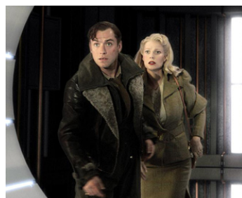
2004 CAPITAINE SKY (Sky Captain and the World of Tomorrow) de Kerry Conrad avec G. Paltrow