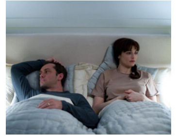
2012 TROIS-CENT-SOIXANTE (360) de Fernando Meirelles avec Rachel Weisz