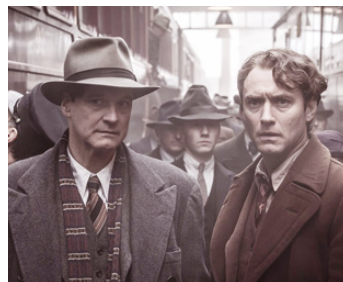
2016 GENIUS (Genius) de Michael Grandage avec Colin Firth