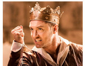
2016 LES CHEVALIERS DE LA TABLE RONDE (Knights of the roundtable) de Guy Ritchie