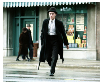
2002 LES SENTIERS DE LA PERDITION (Road to Perdition) de Sam Mendes