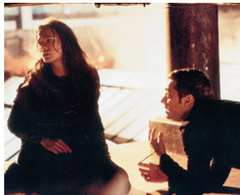
1998 LA SAGESSE DES CROCODILES (The Wisdom of Crocodiles) de Po-Chih Leong avec Elina Löwensohn