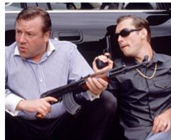
2000 GANGSTERS, SEX & KARAOKE (Love, Honour and Obey) de Dominic Anciano avec Ray Winstone