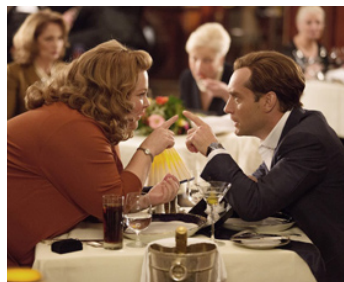
2015 SPY (Spy) de Paul Feig avec Melissa McCarthy