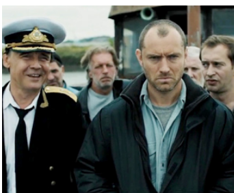
2014 BLACK SEA (Black Sea) de Kevin MacDonalld avec Scoot McNairy