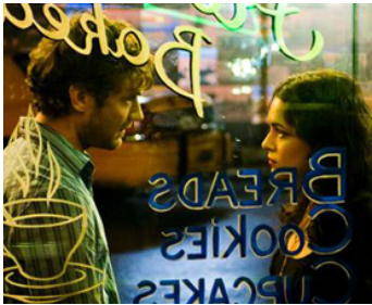
2007 MY BUTTERFLY NIGHTS (My Butterfly Nights) de Wong Kar-wai avec Norah Jones