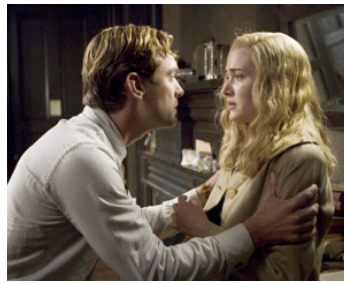
2006 LES FOUS DU ROI (All the King's Men) de Steven Zaillian avec Kate Winslet