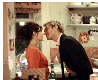
2004 IRRÉSISTIBLE ALFIE (Alfie) de Charles Shyer avec Marisa Tomei