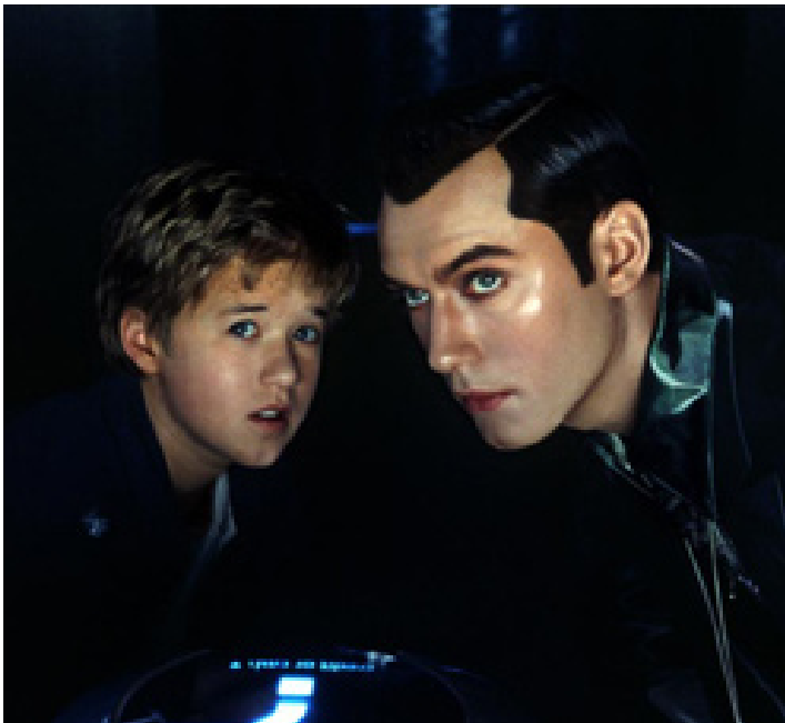
2001 A. I. INTELLIGENCE ARTIFICIELLE (Artificial Intelligence) de S. Spielberg avec Haley Joel Osment