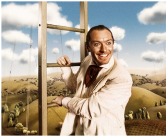
2009 L'IMAGINARIUM DU Dr PARNASSUS (The Imaginarium of Dr Parnassus) de Terry Gilliam