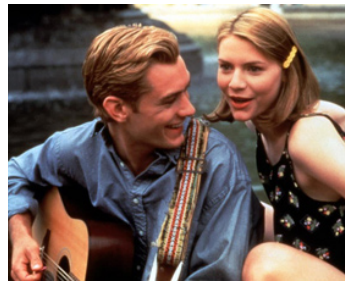
1996 I LOVE YOU, I LOVE YOU NOT de Billy Hopkins avec Clarie Danes