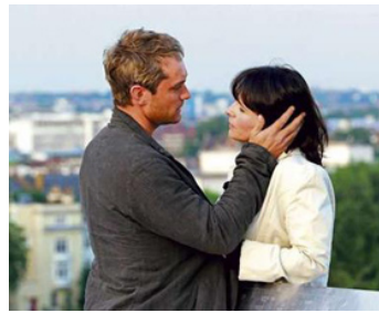
2006 PAR EFFRACTION (Breaking and Entering) d'Anthony Minghella avec Juliette Binoche