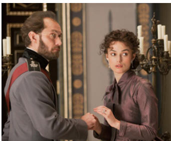
2012 ANNA KARÉNINE (Anna Karenina) de Joe Wright avec Keira Knightley