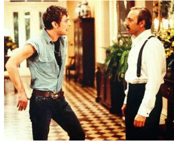
1997 MINUIT DANS LE JARDIN DU BIEN ET DU MAL de Clint Eastwood avec Kevin Spacey