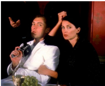
1998 FINAL CUT (Final Cut) de Dominic Anciano et Ray Burdis avec Sadie Frost