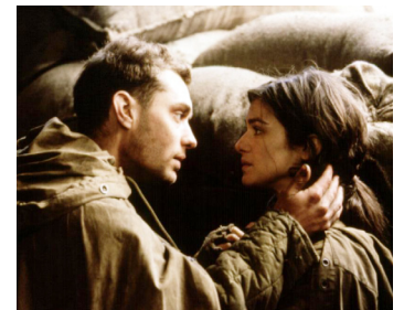
2001 STALINGRAD (Enemy at the Gates) de Jean-Jacques Annaud avec Rachel Weisz