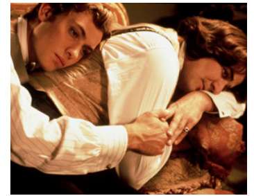
1997 OSCAR WILDE (Wilde) de Brian Gilbert avec Stephen Fry