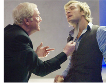
2007 LE LIMIER (Sleuth) de Kenneth Branagh avec Michael Caine