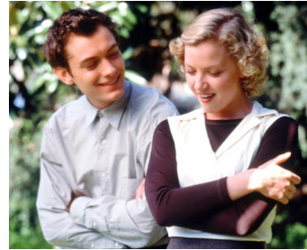
1998 LE CYGNE DU DESTIN (Music from another Room) de Charlie Peters avec Gretchen Mol