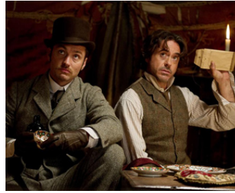
2011 SHERLOCK HOLMES, JEUX D'OMBRES (A Game of Shadows) de G. Ritchie avec Robert Downey Jr