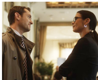
2013 EFFETS SECONDAIRES (Side Effects) de Steven Soderbergh avec Catherine Zeta-Jones