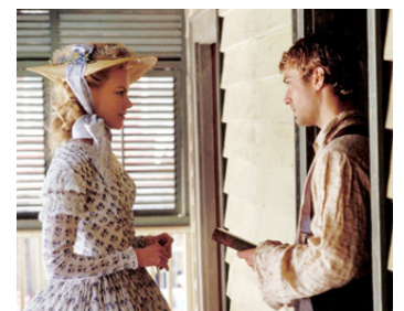
2003 RETOUR À COLD MOUNTAIN (Cold Mountain) d'A. Minghella avec Nicole Kidman