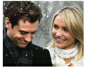
2006 THE HOLIDAY (The Holiday) de Nancy Meyers avec Cameron Diaz